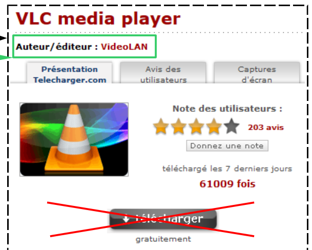
Sur le site 01.net

Une fois sur le site videolan.org, vous pouvez télécharger VLC Media Player.