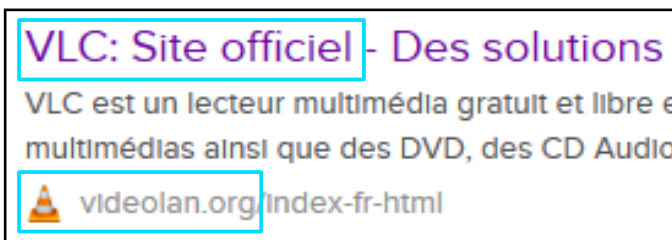
Résultat de la recherche internet pour « VideoLan »

Ne le téléchargez pas depuis le site 01.net ! Cherchez le nom de l'éditeur du logiciel VLC puis rendez-vous sur son site ( videolan.org ) en cherchant le site via votre moteur de recherche internet habituel :